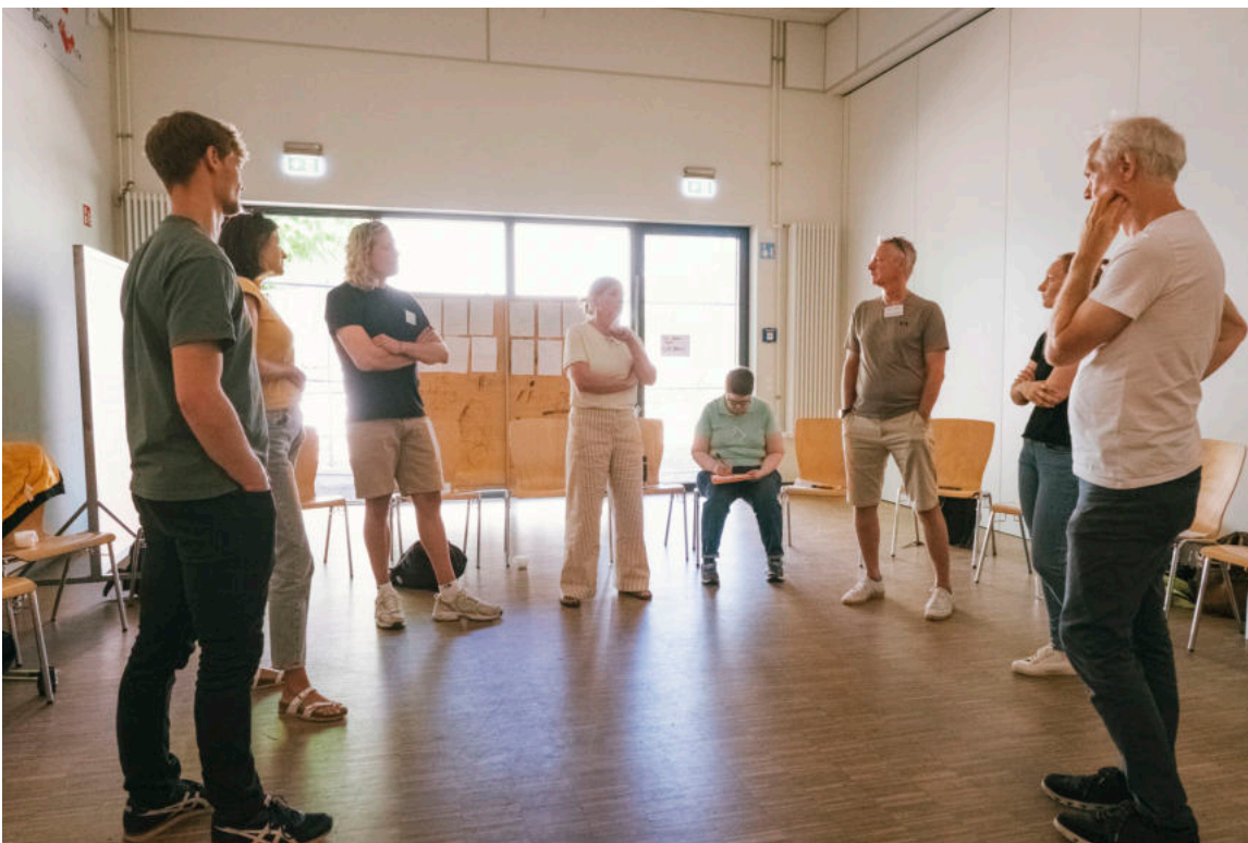
In den Gruppen wurden die genannten Themen vertieft.