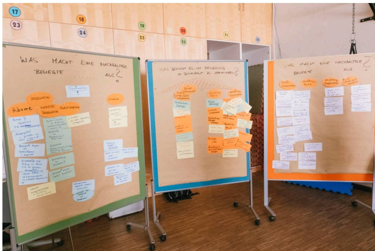
Die Ergebnisse aus den Gruppen wurden im Plenum vorgestellt.

Um den weiteren Austausch zwischen den Akteuren im Sozialraum sicherzustellen und Synergien zu ermöglichen, braucht es außerdem auch eine gut funktionierende Vernetzung, bzw. eine thematische Bündelung von Netzwerk- / Austauschrunden.