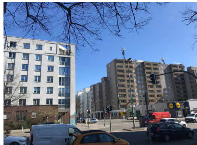
Ansichten aus dem Brunnenviertel.