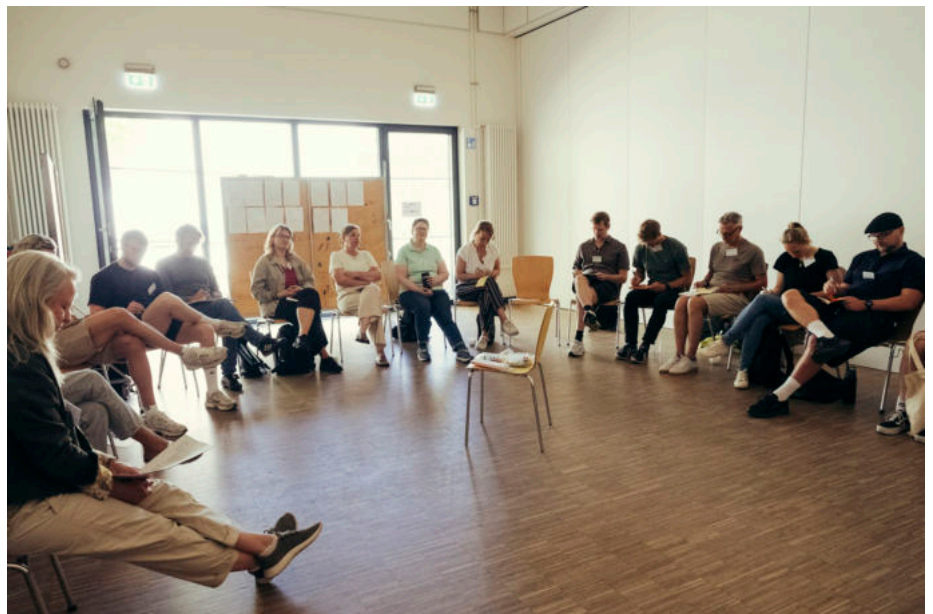
Teilnehmende des Fachaustauschs.