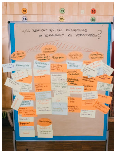
Im Plenum wurde das „Bewegungshaus“ erarbeitet.