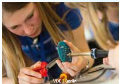
VDE | Berlin