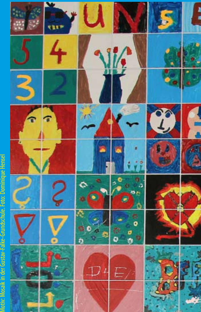
Maler: Mosaik in der Gustav-Falke-Grundschule.

mit abtrennbarem Sommerferienkalender 2016