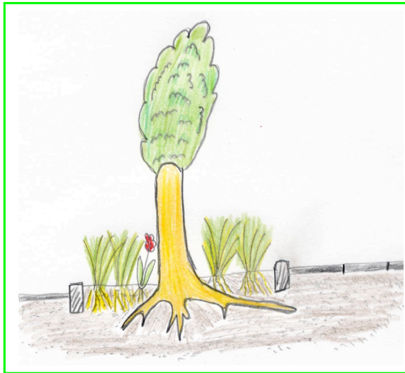
Abb. 1: Bei einem jungen Baum besteht die Möglichkeit die Baumscheibe mit kleinen Gehölzen, Stauden und Blumen zu bepflanzen