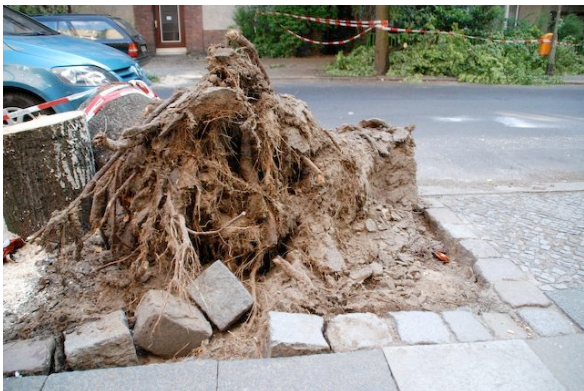
Abb.3 : Ohne äußere Anzeichen breitete sich in diesem Baum eine Fäule aus, die zum Umsturz im belaubten Zustand führte

Die Baumscheibe trägt die Wurzelplatte des Baumes. Wird die Verankerung des Baumes beschädigt kommt es zu Fäulen innerhalb des Stammes. Diese Fäulen bauen das Holz des Baumes ab. Durch diesen Holzabbau verliert der Baum seine Verankerung im Boden und stürzt im belaubten Zustand um. Jede Baumart bildet eine andere Wurzelplatte aus. Baumarten wie der Ahorn bilden zum Beispiel so massive Wurzelplatten aus, dass dort eine Baumscheibenbegrünung bei älteren Bäumen nicht möglich ist.